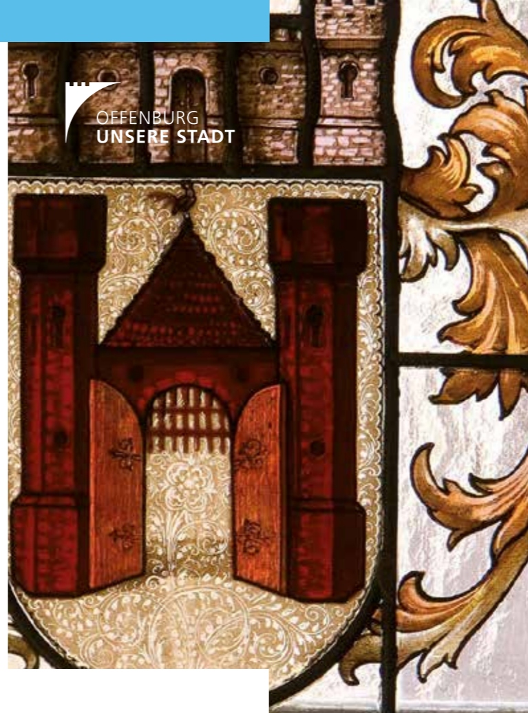
Abbildungen: K. Schlessmann, G. Siefker, Stadt Offenburg, Fachbereich Bauservice, Abt. Flächenmanagement

Eine Anmeldung ist erforderlich. Telefonisch unter 0781 82 22 17 oder per E-Mail: stadtmarketing@offenburg.de Preis pro Person: 17 €, Weinverkostung ab 16 J., Gruppenführungen sind nach Vereinbarung möglich.