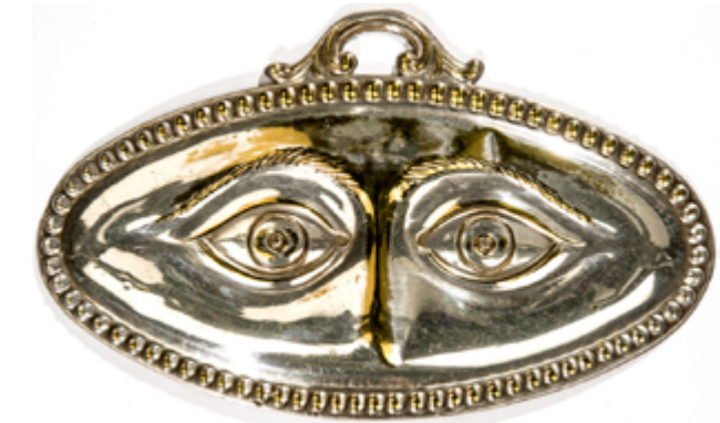
Abbildung: Votivgaben „Augen“, Silberblech, Italien, 19. Jh.

Comment la foi s'est-elle transformée, notamment ses signes et ses attributs? Comment les gens l'ont vécue chez eux, mais aussi en route, au public, et comment est-elle vécue aujourd'hui? Avec quels rites et à travers quels objets sacrés la foi se manifeste?