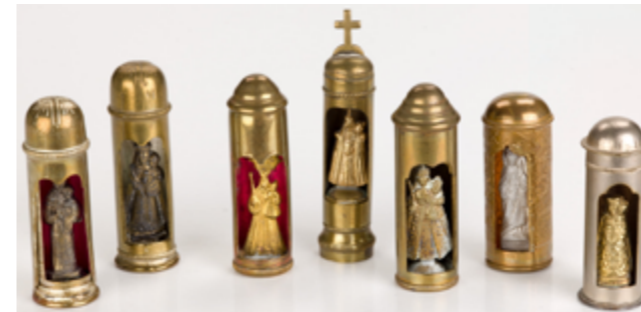
Abbildung: Verschiedene Reise-Segen, Messingzylinder mit kleinen als Wallfahrtsandenken gedachten Statuetten, Anfang 20. Jh.

En même temps, de millions de personnes ont prié pour le défunt pape François. Et son successeur Léo XIV fut accueilli avec enthousiasme et plein d'espoir. Les congrès évangélique en Allemagne attirent régulièrement un grand et jeune public. Y sont souvent éprouvées de formes nouvelles de religion et de foi personnelle.