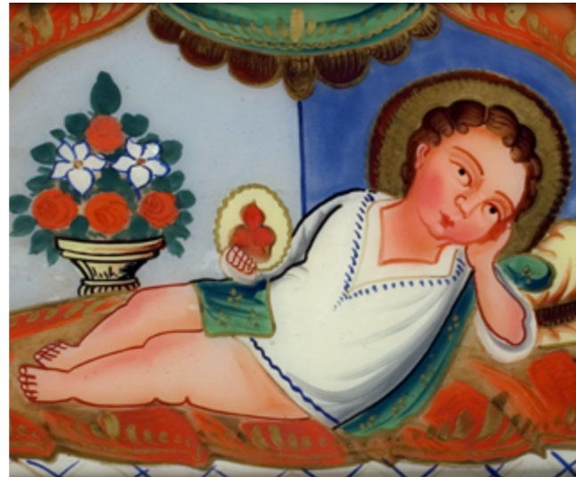
Abbildung: Hinterglasmalerei mit liegendem Jesuskind, Sizilien, um 1850