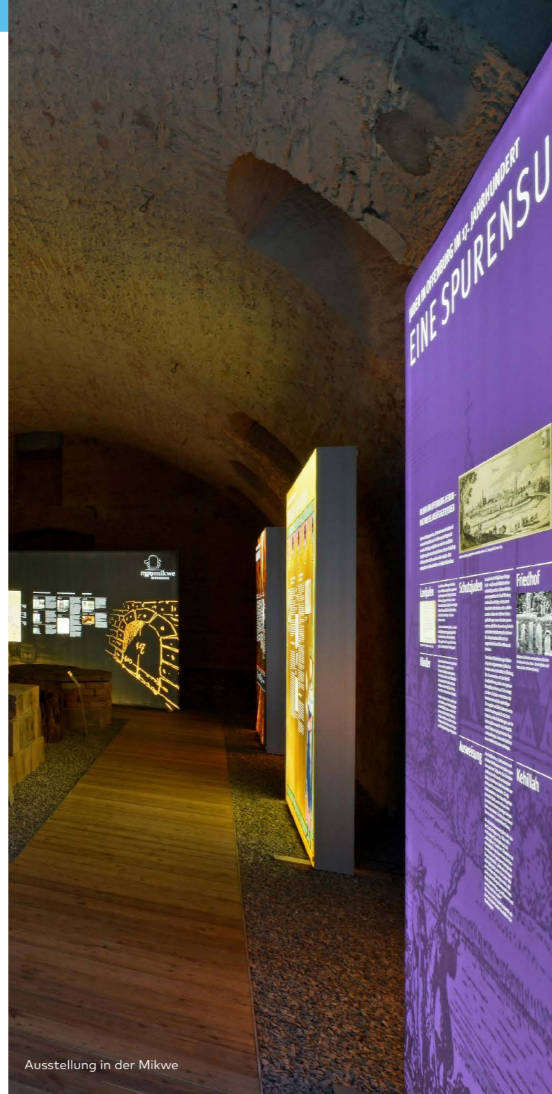
Ausstellung in der Mikwe